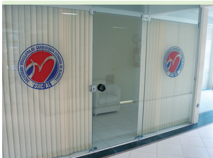
Sala onde começou a funcionar a sede da SBC/AL

O presidente da SBC, por sua vez, disse que já está trabalhando para concretizar as sedes próprias de outras estaduais da SBC e que possivelmente os próximos Estados a serem beneficiados serão Sergipe, Amazonas, Piauí e Mato Grosso, e disse que aproveitou a realização do Congresso Norte-Nordeste para iniciar esse programa cujo objetivo final, repetiu, é dotar cada ramo estadual da SBC de sua própria sede.