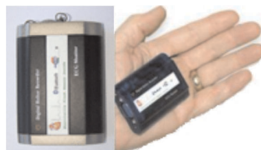
Mini Gravador Digital