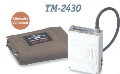
MAPA AND TM-2430