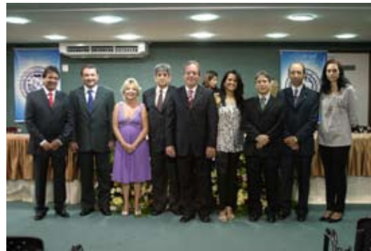
Diretoria, biênio 2008-2009, em foto na confraternização pela posse da nova gestão.