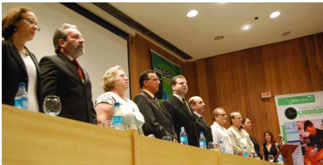
A adesão em massa foi destaque no congresso da estadual, fundada há apenas sete meses.

Agradecimentos: A SBC/RO agradece o patrocínio da Unimed Rondônia, do Conselho Regional de Medicina do Estado de Rondônia (Cremero) e do Conselho Federal de Medicina (CFM).