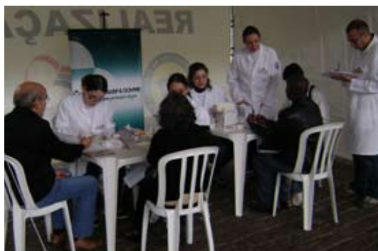
Em São Paulo, 45% das 215 pessoas atendidas apresentaram colesterol total acima dos 200 mg/dl.

Exames gratuitos, palestras e sessões de massagens para relaxamento foram programados em dois shoppings de Brasília. No Largo da Alfândega, em Florianópolis, houve dosagem de colesterol, orientações e distribuição de material educativo. Já em Belém, a ação aconteceu em um dos locais mais movimentados da capital paraense e cartão postal da cidade, o Mercado Municipal Ver o Peso.