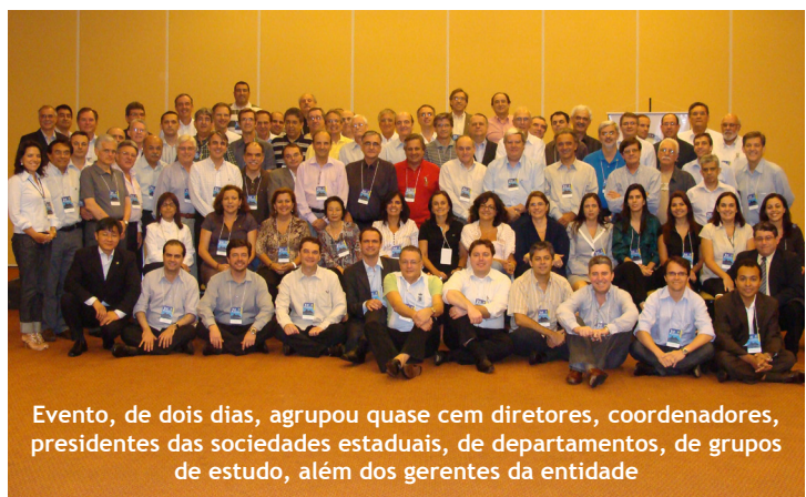
Evento, de dois dias, agrupou quase cem diretores, coordenadores, presidentes das sociedades estaduais, de departamentos, de grupos de estudo, além dos gerentes da entidade