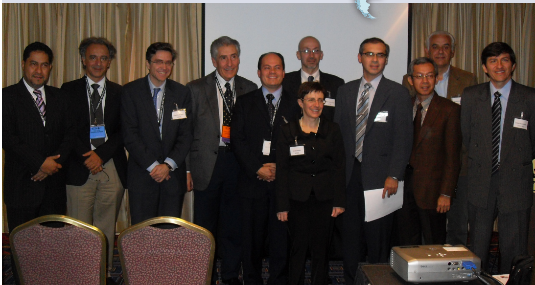
Encontro reuniu editores e representantes de 11 publicações ibero-americanas.